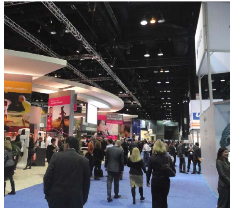
「Radiological Society of North America(RSNA)2014」 会場風景